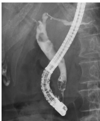
治療前：複数の結石を認める

もし、総胆管結石症でお困りの患者さまなどがいらっしゃいましたら、お気軽に当院にご相談ください。よろしくお願いいたします。