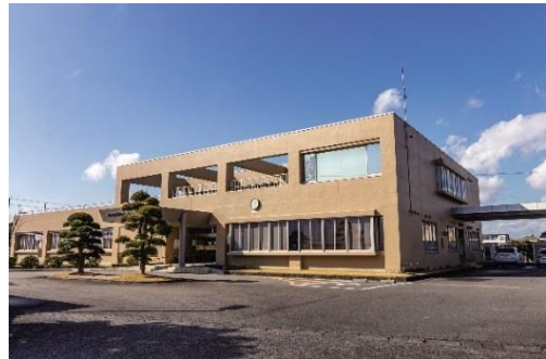
（菊川市家庭医療センター）

菊川市立総合病院第4次中期計画において、地域連携・医療提供体制の推進事業として菊川市家庭医療センター（あかつちクリニック）との連携に取り組んでいます。その方針のもと整形外科・内科疾患・フレイル（虚弱）予防などの患者様を対象に、医療保険下での外来リハビリテーション